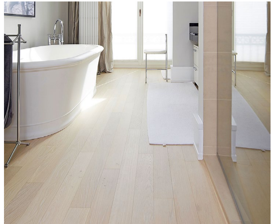
Früher undenkbar, heute möglich: Parkett im Bad. Es empfiehlt sich ein nicht allzu breites Massiv- oder geeignetes Mehrschichtparkett sowie eine geölte Oberflächenbeschichtung. Dadurch kommt es nicht gleich zu einer Beschädigung, wenn grössere Wassermengen aufs Parkett gelangen. Das Wasser sollte aber trotzdem vom Boden entfernt werden.

Bei verlegtem Parkett gelangen vom Rohmaterial nur noch die unbedenklichen und natürlichen Inhaltsstoffe des Holzes in die Raumluft. Parkett enthält keine Weichmacher oder andere schädliche Substanzen, die über Jahre aus dem Fussboden austreten und beim Nutzer zu gesundheitli-