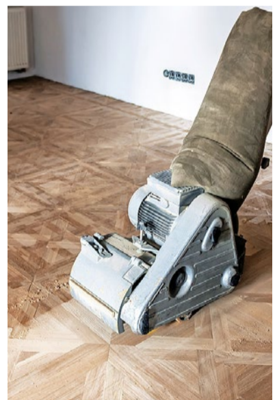
0,5 bis 0,7 mm Holz werden mit der Schleifmaschine abgetragen.

Alles rund ums Thema Parkett finden Sie auf der Website der Interessengemeinschaft Schweizer Parkett ISP: www.parkett-verband.ch