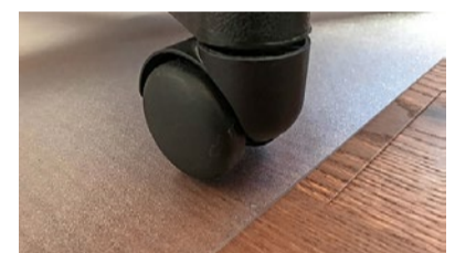
Vorsicht bei ungeeigneten Stuhlrollen auf Parkett – hier ist der Einsatz einer Schutzmatte empfehlenswert.